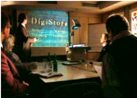
Multimedialer Vortrag mit PARTOUT®