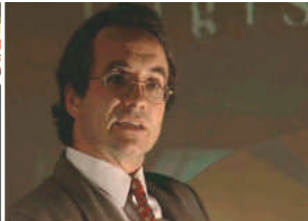
Stressfrei präsentieren mit PARTOUT®