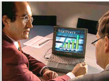
PARTOUT® unterstützt das individuelle Verkaufsgespräch