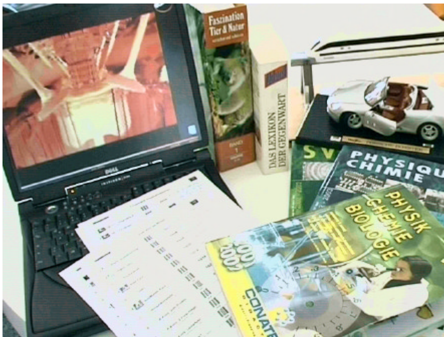
Die Barcode-Funktion in PARTOUT® verbindet Multimedia mit Katalogen, Prospekten, Büchern, Modellen und Exponaten.