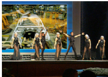
PARTOUT® untermalt jeden Auftritt, unterstreicht die Botschaft des Vortrags – und veredelt jeden Event

PARTOUT® steht für eine einmalig intuitive Nutzung von Multimedia-Inhalten. So können zu jeder Zeit faszinierende visuelle und akustische Effekte über die Leinwand gehen – das Hören und das Sehen vermittelt große Emotionen und bleibende Eindrücke.