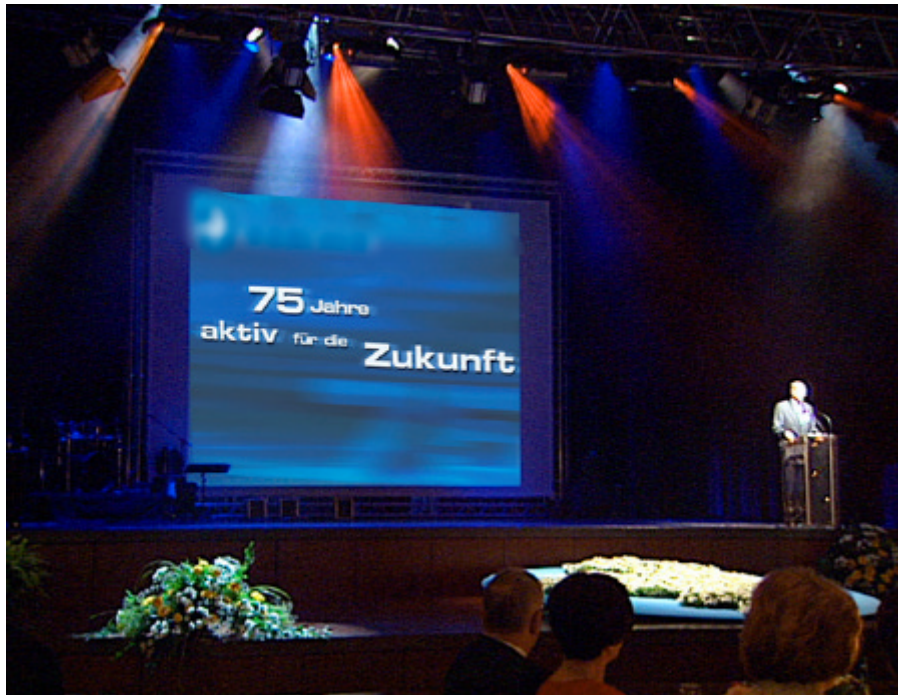
PARTOUT® unterstützt, wie hier, alle Beiträge absolut sicher - das Motto bleibt immer im Vordergrund

Mit PARTOUT® ist es jetzt möglich, schnell Multimedia-Shows zu erstellen, um sie dann absolut sicher, stressfrei und professionell zu präsentieren.