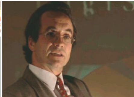
Stressfrei präsentieren mit PARTOUT®