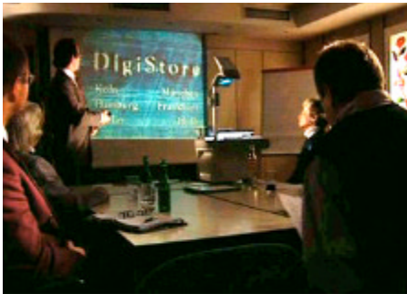
Multimedialer Vortrag mit PARTOUT®