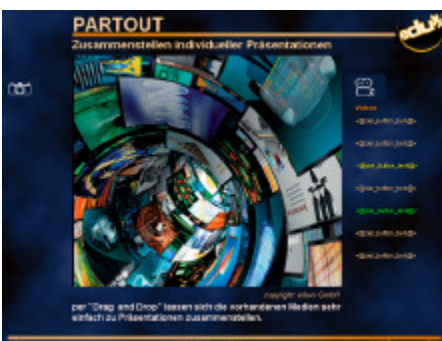
Mit PARTOUT® Fertig in Minuten: Videothek – integriert in einen individuell gestalteten Multimedia-Screen